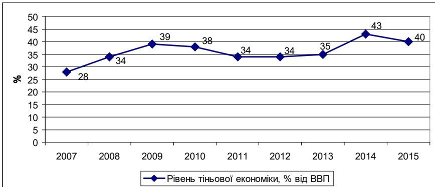
Рисуюнок 1. Рівень тіньової економіки в Україні [5]

Відповідно до розрахунків Міністерства економічного розвитку та торгівлі України рівень тіньової економіки в Україні за 2007–2015 рр. у середньому становив 36,1% від обсягів офіційного ВВП (див. рис. 1). Такий факт перевищення тіньовою економікою критичного рівня у 30% від ВВП засвідчує про посилення її негативного, руйнівного впливу на національну економічну систему [5] та створення додаткових можливостей для поширення корупції, недоотримання податкових надходжень, вчинення інших правопорушень.