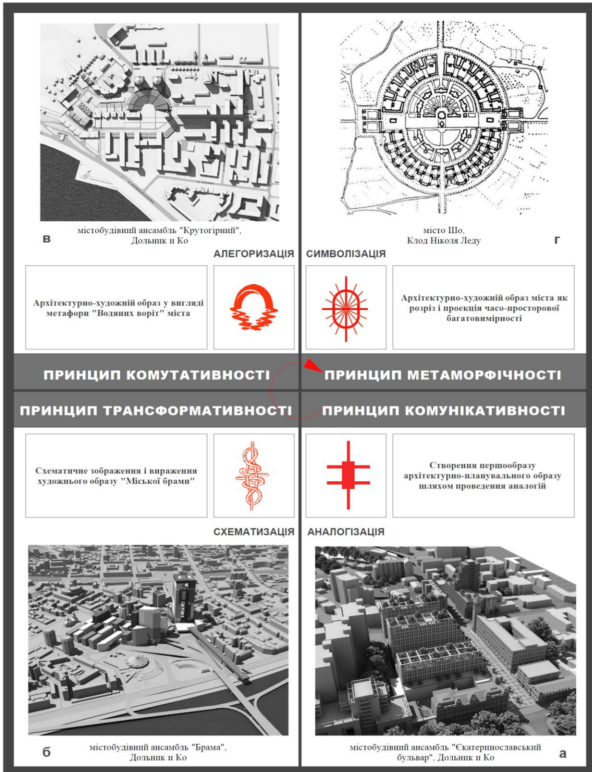
Рис. 2. Принципи символізації архітектурно-художнього образу міського середовища на глобальному (загальноміському) та макрорівні (головні вулиці, площі і містобудівні ансамблі).