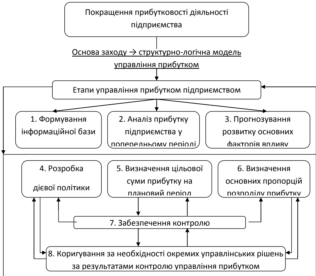
Рис. 2. Рекомендована структурно-логічна схема управління прибутком з позиції підвищення рівня прибутковості підприємства (складено авторами).

стратегічному управлінні займає внутрішнє планування. З метою покращення дієвості управління прибутком підприємства запропонована структурно-логічна схема управління прибутком (рис.2).