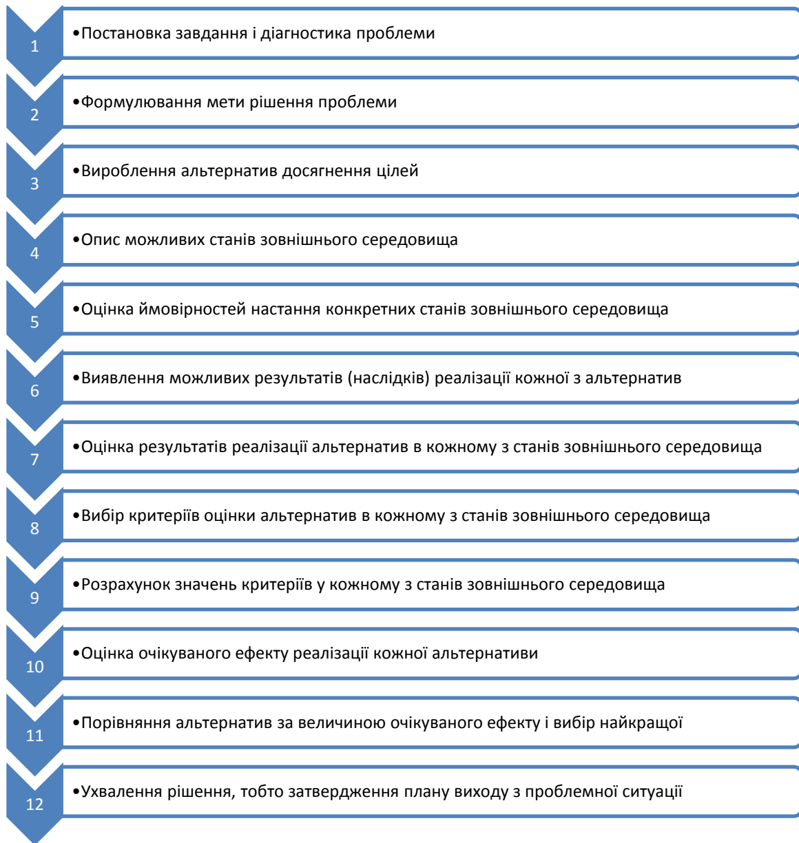
Рис. 2. Етапи прийняття рішень

Слід зазначити, що метод управління складається з декількох етапів та їх виконання можуть впливати на ефективну роботу підприємства. Така особливість даного класу рішень призвела до появи різноманітного інструментарію у вигляді теоретичних рекомендацій, математичних методів і комп'ютерних програм, призначених для підвищення ефективності управлінських рішень. Таким чином, можна сказати наступне, що ефективне управління може істотно впливати на рівень фінансової безпеки підприємства, будь-яке управлінське рішення тягне за собою позитивні або негативні наслідки. Використання того чи іншого методу управління починається з моделювання проблемної області. Модель визначення проблемної області при