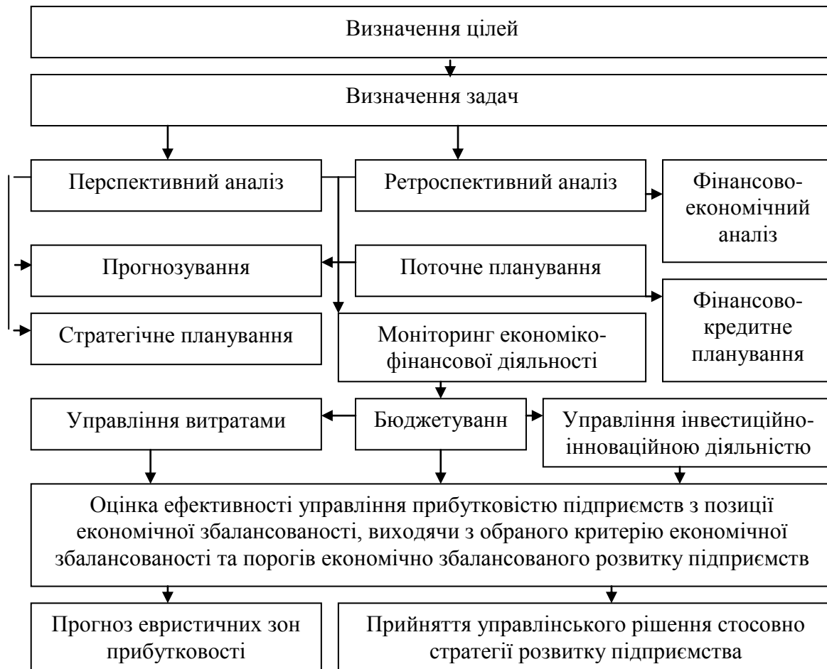
Рис. 3. Модель стратегічного управління прибутковістю підприємств з позиції економічної збалансованості [5, с. 151]

підприємств. Запропоновану модель управління прибутковістю підприємств з позиції економічної збалансованості наведено на рис. 3.