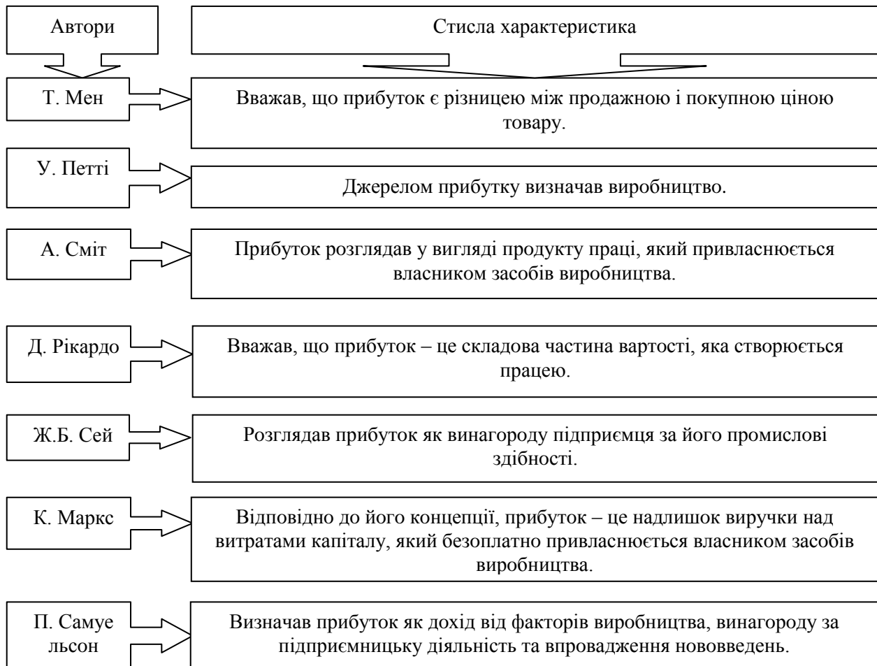
Рис. 1. Основні концепції економічної сутності прибутку [8, с. 238]

Для детального та достовірного дослідження прибутку, необхідно уточнити його економічну сутність на основі окреслення еволюційно-історичного шляху формування наукових поглядів вітчизняних і зарубіжних вчених стосовно його трактування (рис. 1).