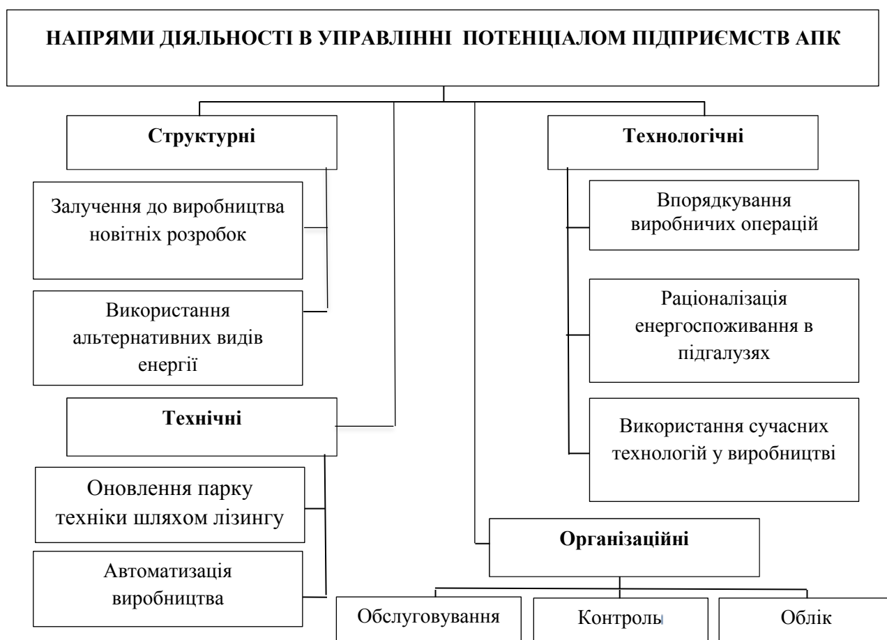
Рис. 2. Комплекс напрямів забезпечення зростання потенціалу підприємств АПК[2]

Більшість вітчизняних аграрних підприємств сьогодні функціонують на межі виживання, а управління їхнім потенціалом спрямоване, в першу чергу, на забезпечення поточних результатів діяльності. Проте, розвиток ринкових відносин в Україні вимагає зміни стратегії управління потенціалом аграрних підприємств у бік забезпечення стійких конкурентних переваг, формування яких є гарантом ефективного функціонування підприємства в довгостроковій перспективі. Тому серед напрямів управління нарощуванням потенціалу підприємствами АПК слід виділити наступні (рис. 2).