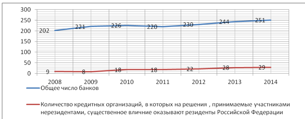
Рис.2 .Количество действующих кредитных организаций с участием нерезидентов в уставном капитале

составляло – 923 единиц. В 2013 году Центробанком были отозваны лицензии у 33 кредитных организаций [2], а за первое полугодие текущего года – еще у 38 банков [2], что в свою очередь приводит к дополнительному давлению на динамику банковского сектора страны. На основе этого можно сказать, что сохраняется тенденция последних лет к сокращению числа действующих кредитных организаций. Это сопровождается увеличением доли банков с участием иностранного капитала, которая на 01.01.2014 года составила 12% от общего числа банков страны (Рисунок 2).