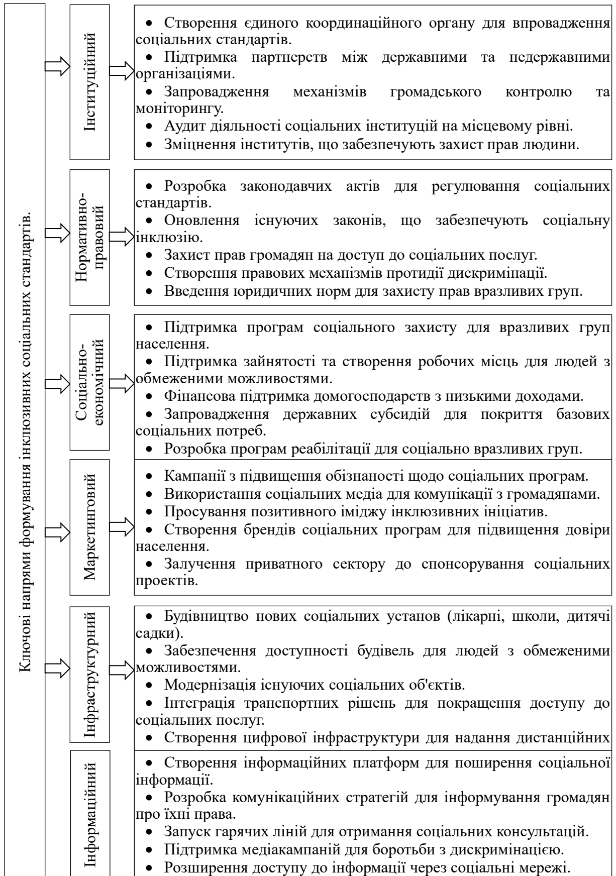
Рис. 2. Ключові напрями формування інклюзивних соціальних стандартів