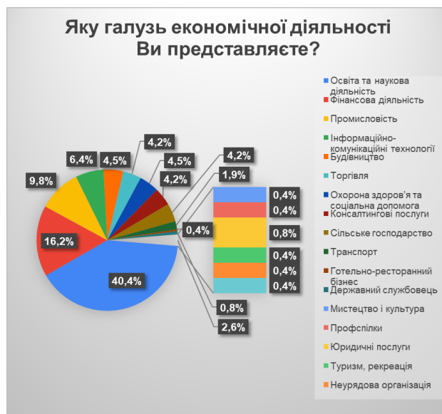
Рис. 2. Розподіл респондентів за галузями економічної діяльності