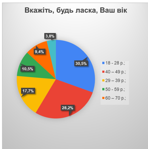
Рис. 1. Розподіл респондентів за віком