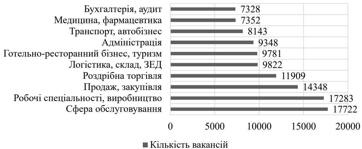
Рис. 2. Категорії з найбільшою кількістю вакансій у 2024 році

спостерігається у сфері обслуговування, робочих та виробничих спеціальностей (рис. 2).