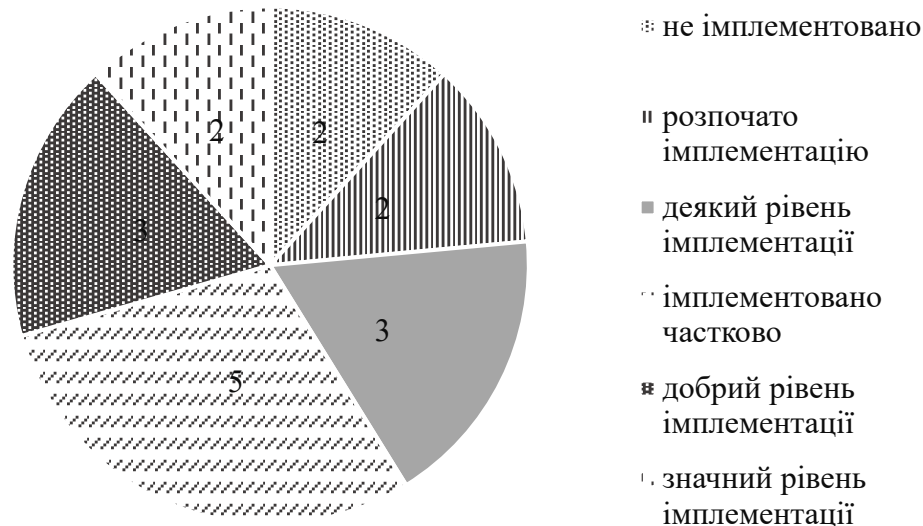
Рис. 2. Стан актів права Європейського Союзу, що підлягають імплементациі на митниці на момент 2023 року [2]

В звіті Кабінету міністрів України за результатами проведення первинної оцінки стану імплементациі актів права Європейського Союзу було сказано, що на сьогодні у митному законодавстві імплементовано 742 акти, при цьому 17 актів ще підлягають коригуванню. Щодо податкового законодавства, успішна імплементация 90% актів свідчить про значний прогрес в цьому напрямі. Однак, важливо відзначити, що успіх у гармонізації податкових правил не означає автоматичної ефективності податкової системи. Податкова система повинна бути не лише сумісною з європейськими стандартами, але й прозорою, простою для сплати податків та відповідною до потреб економіки та суспільства.