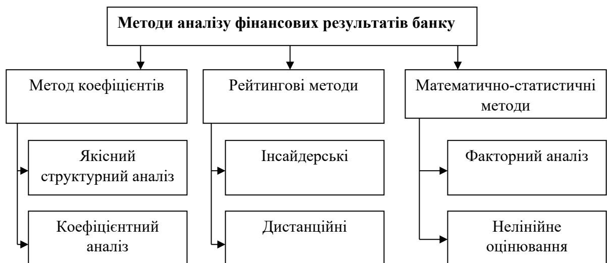
Рис. 2. Методи аналізу фінансових результатів діяльності банківської установи [2; 15]