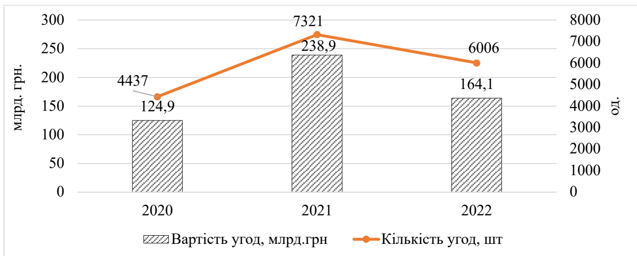
Рис. 4. Динаміка глобальної інвестиційної діяльності фінансових технологій у 2020-2022 рр.

Якщо порівнювати показники 2020-2021 рр., то слід відмітити позитивну тенденцію росту. Так, вартість угод, укладених як міжнародні інвестиції у фінансові технології на кінець 2021 р. становила 238,9 млрд. грн, а кількість укладених договорів - 7321. Це майже вдвічі більше, ніж було у попередній рік. Але, враховуючи кризу, яка була зумовлена повномасштабним вторгненням РФ на територію України, у 2022 р. показники мали тенденцію до зниження. Так, вартість укладених угод у 2022 р. становила 164,1 млрд. грн, а кількість укладених договорів зменшилася до 6006 одиниць. Слід зазначити, що навіть попри зниження показників у 2022 р. проти рівня показників 2021 р., їх значення було більше за показники 2020 р.