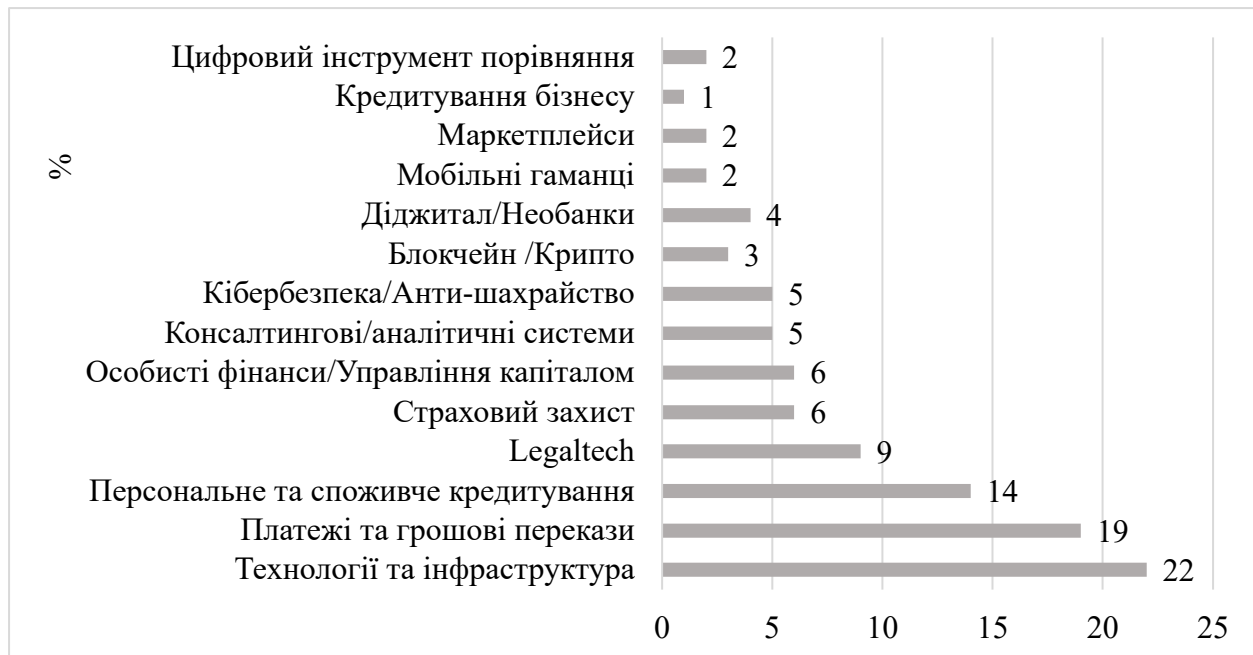
Рис. 2. Розподіл фінтех компаній України за сферами діяльності на початок 2022 р., %

Аналіз даних рис. 2 дають змогу зробити висновки, що на ринку України серед фінтехкомпаній найвагомішими та найпопулярнішими є компанії, які працюють у сфері технології та інфраструктура (22% у загальній структурі). Друге місце займають фінтех компанії у сфері платежів та грошових переказів, їх частка у загальній структурі 19%. І третє місце, з часткою 14%, займають фінтех компанії у сфері персонального та споживчого кредитування.