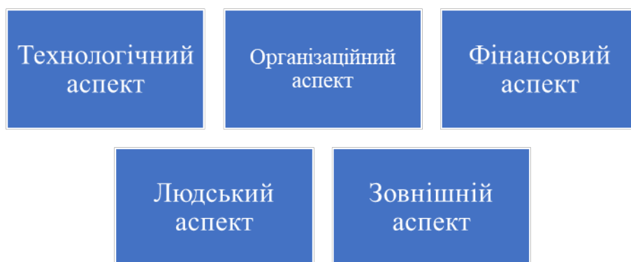
Рис. 4. Ключові аспекти інноваційного розвитку підприємства

Спираючись на представлені вище принципи, які пропонують дослідники, а також взявши до уваги їх висновки щодо класифікації, можемо зазначити ключові аспекти інноваційного розвитку підприємства (рис. 4).