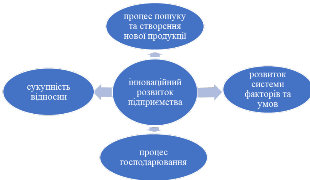
Рис. 1. Визначення поняття «інноваційний розвиток підприємства»

Виклад основного матеріалу. На підставі аналізу наукових джерел автори дослідження стверджують, що існує багато підходів до визначення поняття «інноваційний розвиток підприємства» як в українській, так і в зарубіжній літературі. Кожен із цих підходів враховує особливості економіки конкретної країни та власну позицію науковця. Виокремимо основні визначення поняття «інноваційний розвиток підприємства» (рис. 1):