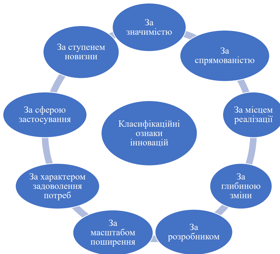
Рис. 3. Загальна класифікація інновацій