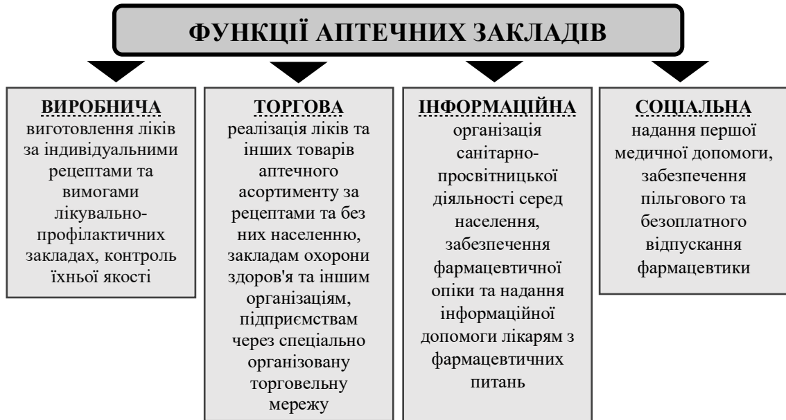
Рис. 1. Функції аптечних закладів

аптеки є задоволення потреб населення у наданні кваліфікованої та своєчасної фармацевтичної допомоги, відповідно до чинного законодавства та міжнародних стандартів. Окрім основного завдання, аптечні заклади також виконують ряд функцій (рис.1).