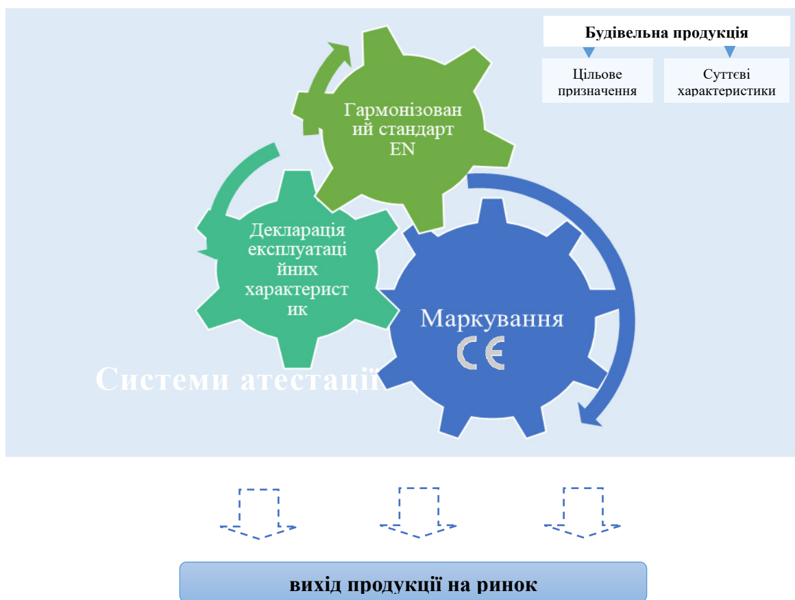
Рис. 2. Елементи Регламенту 305/2011 Джерело: удосконалено авторами

Наступним важливим елементом Регламенту ЄС 305/2011 є системи атестації, що, відповідно до ініціативи уряду України, повинні бути поступово впроваджені на вітчизняному рівні. Існує