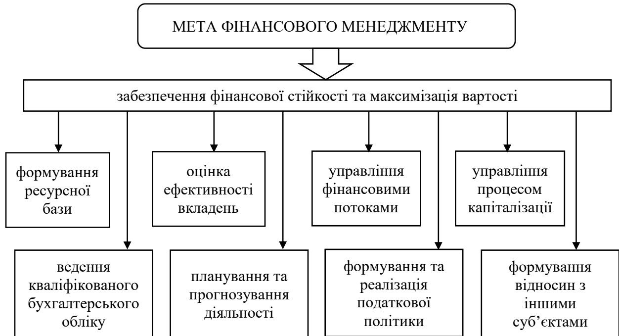
Рис. 4. Завдання фінансового менеджменту в системі формування фінансової безпеки аграрних підприємств

допоможуть досягти основної мети – забезпечення фінансової стійкості та максимізації ринкової вартості підприємства (рис. 4).