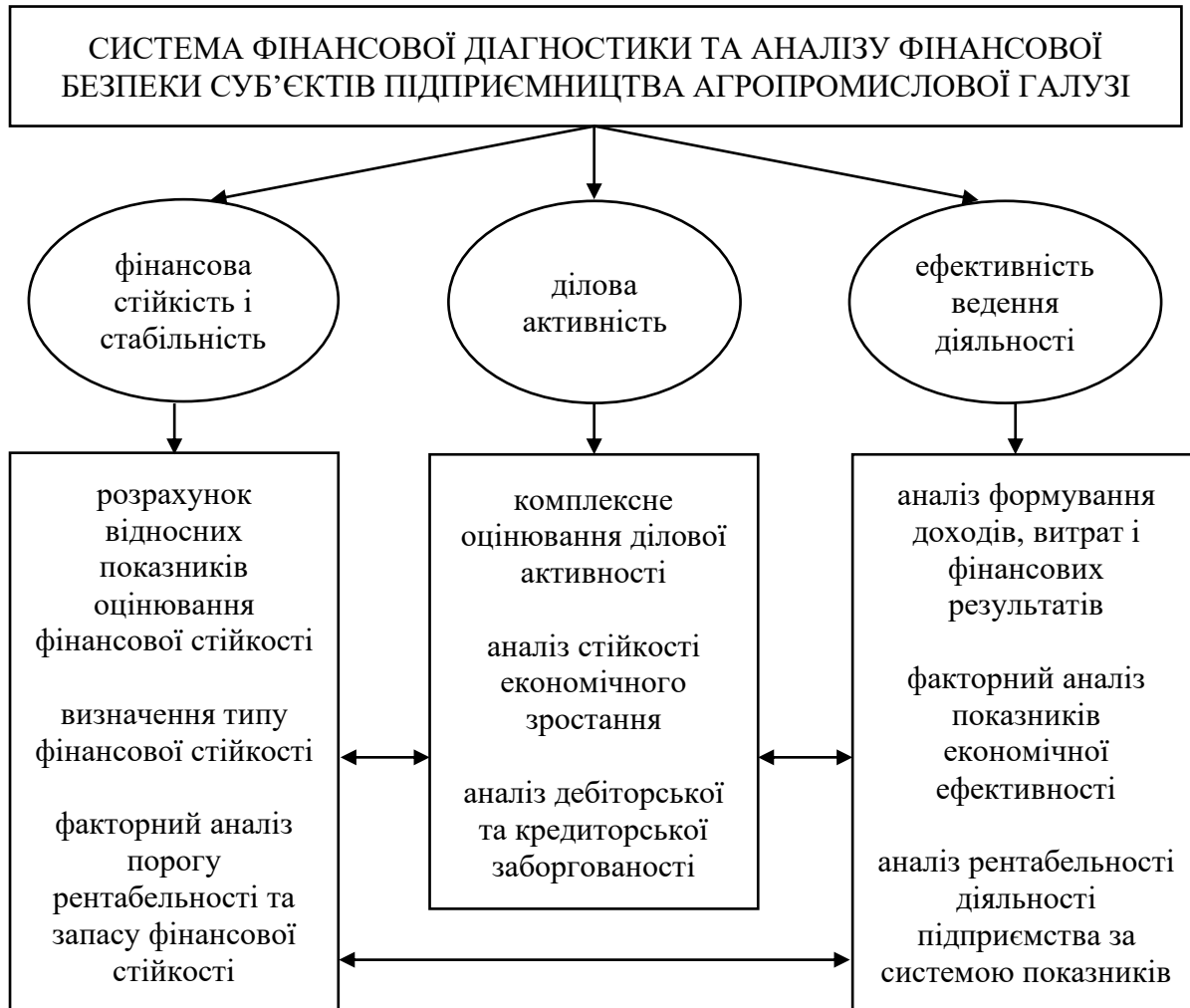
Рис. 2. Система фінансової діагностики та аналізу фінансової безпеки суб'єктів підприємництва агропромислової галузі