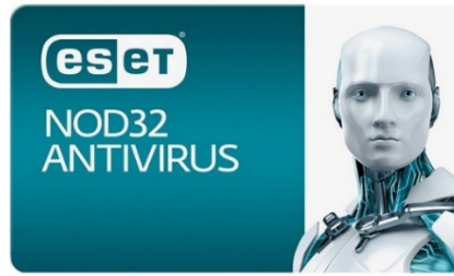
Рис. 6. Логотип ESET NOD32