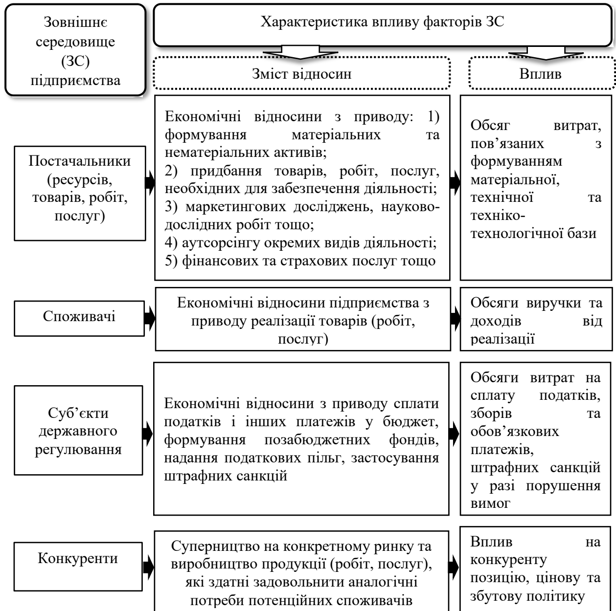
Рис. 4. Зовнішні прями фактори впливу на ФСП

впливають на його діяльність та визначають конкурентоспроможність на ринку, фінансовий стан та фінансову стійкість.