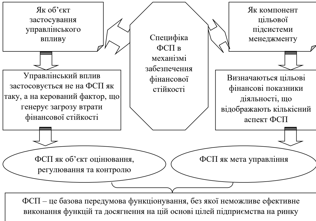
Рис. 2. Специфіка ФСП у структурі механізму оцінювання та управління