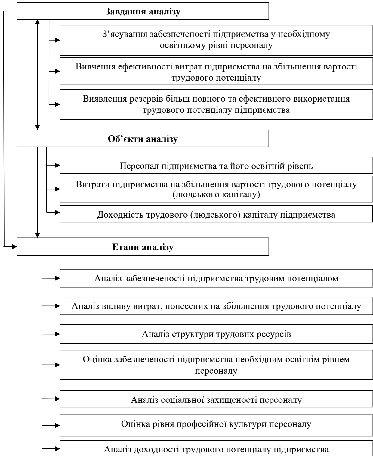
Рис. 1. Завдання, об'єкти та методика економічного аналізу трудового потенціалу суб'єкта господарювання