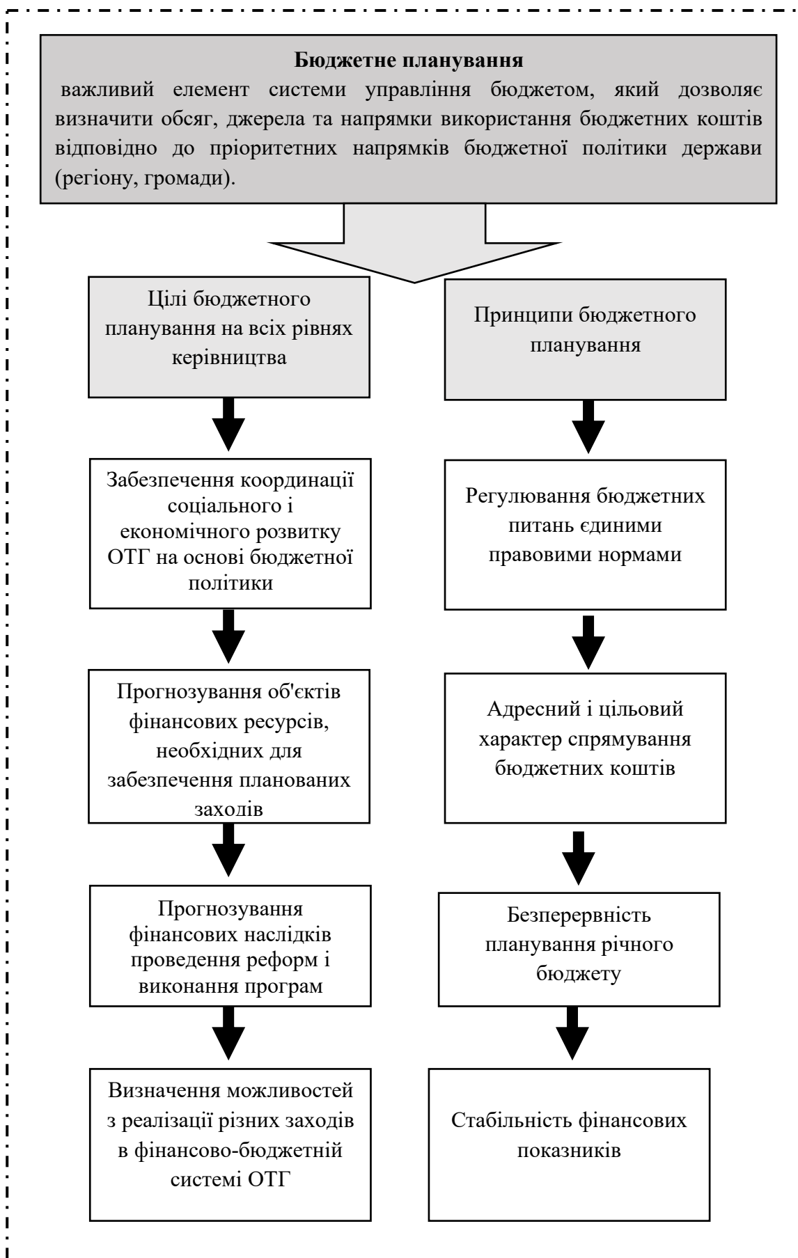
Рис. 1. Основні цілі і принципи бюджетного планування