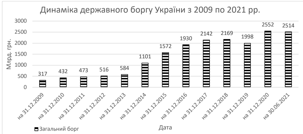
Рис. 1. Динаміка державного боргу України протягом 2009-2021 рр.

На рис. 1 представлено динаміку державного боргу України протягом 2009-2021 рр.