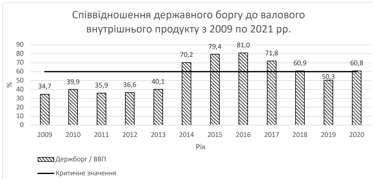
Рис. 3. Динаміка співвідношення державного боргу до валового продукту з 2009 по 2021 рр.

Одним зі важливих індикаторів економічної безпеки є співвідношення державного боргу до ВВП, в Україні це значення немає перевищувати 60-ти відсотків [7]. Динаміка вищезгаданого показника відображена на рис. 3.