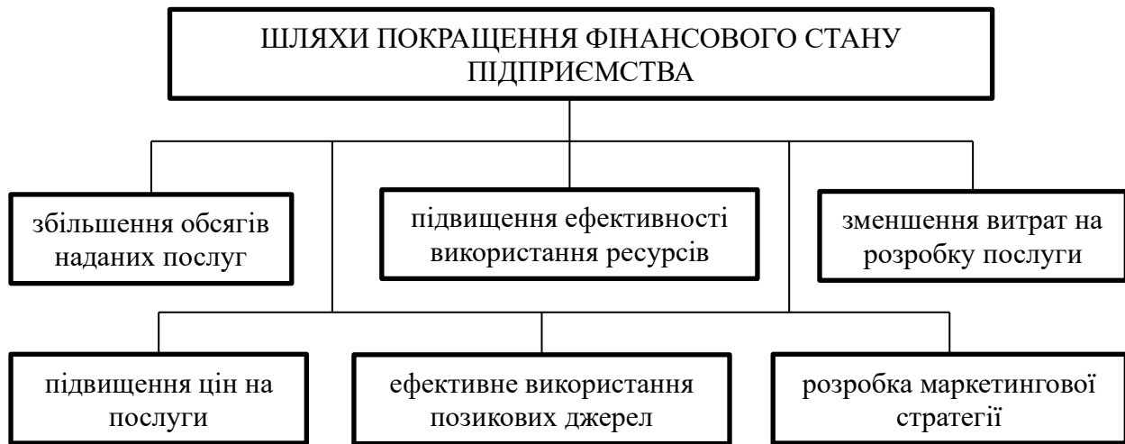
Рис. 3. Шляхи покращення фінансового стану підприємства