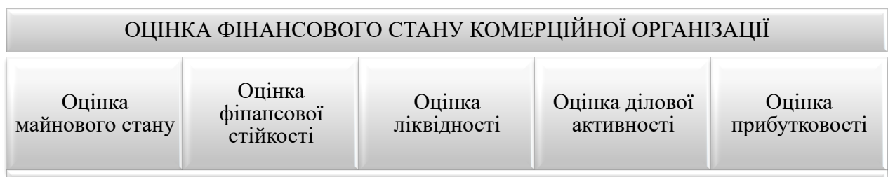
Рис. 1. Групи показників оцінки фінансового стану підприємства [5]

Оцінка фінансового стану включає в себе декілька блоків показників (рис. 1).