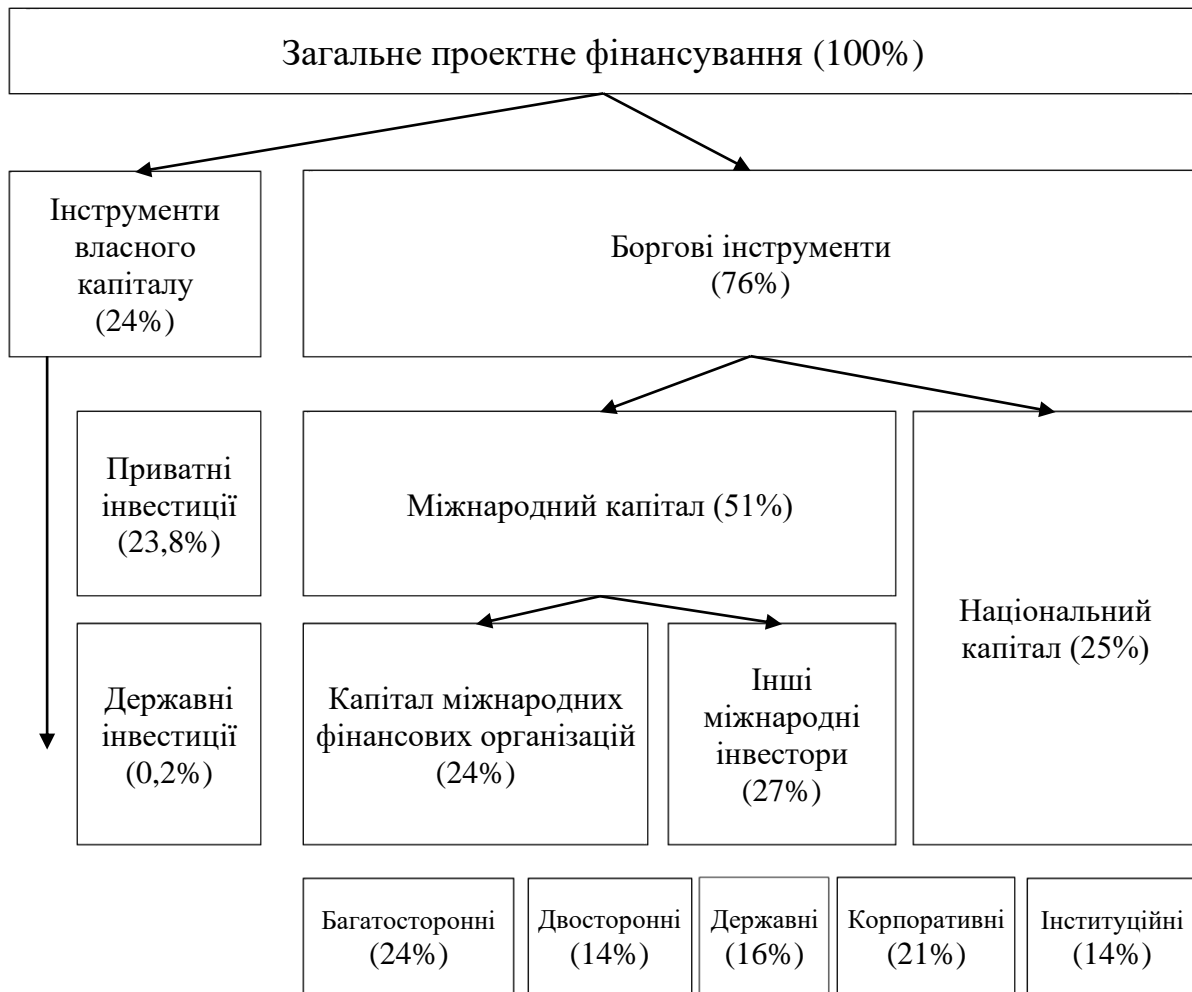
Рис. 2. Структура проектного фінансування інфраструктурних проектів у країнах з економікою що розвивається у 2020 р.