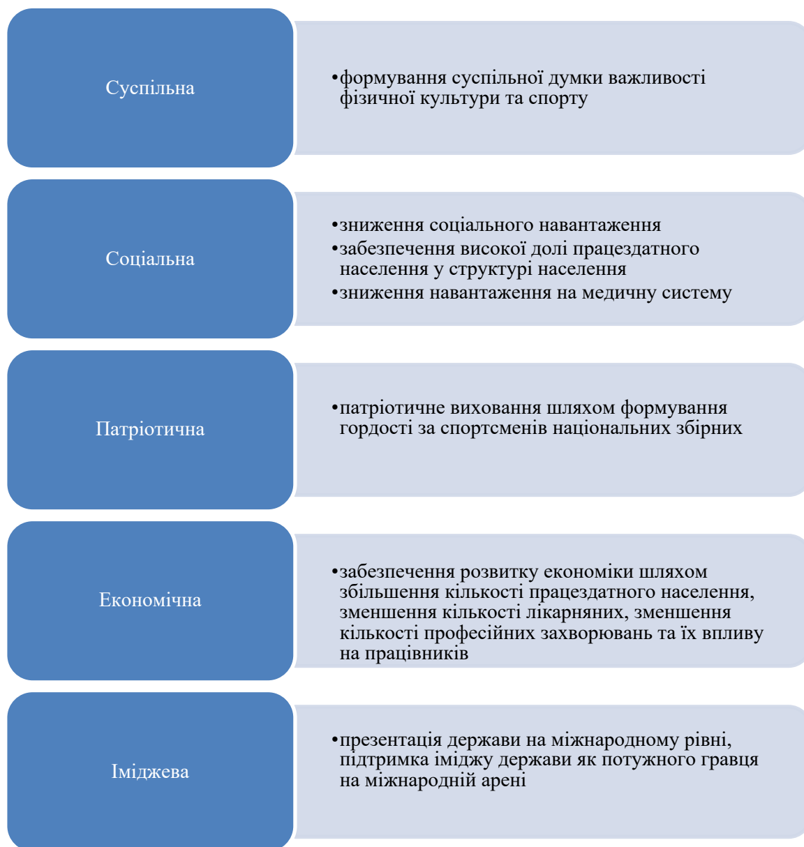
Рис. 3. Функції держави, що виконує політика розвитку фізичної культури та спорту

Як бачимо на рис. 3 держава виконує шляхом підтримки фізичної культури та спорту низку важливих функцій: суспільну, соціальну, економічну, патріотичну та іміджеву. Поліфункціональність процесів розвитку фізичної культури та спорту визначає необхідність системного підходу до забезпечення державної політики у цій сфері.