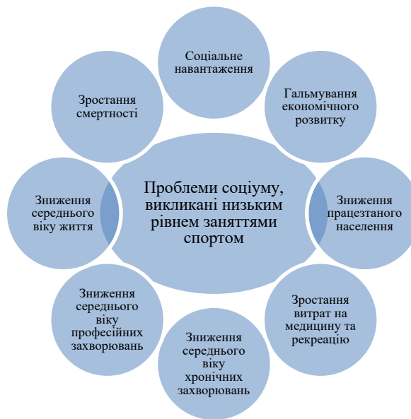
Рис. 2. Негативні наслідки тенденцій зниження кількості людей, що займаються фізичною культурою та спортом [3-5]

Як бачимо, проблеми розвитку фізично культури та спорту мають як фізіологічний характер, так і впливають нас соціально-економічний розвиток суспільства, отже мають пряме відношення до системи державного управління.