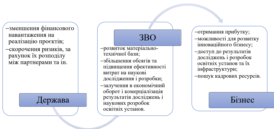
Рис. 1. Мотивація взаємодії учасників ДПП у сфері освіти [4; 8; 10; 11].