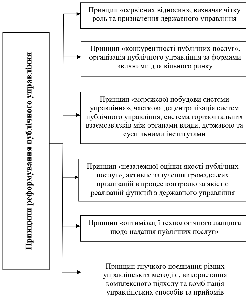
Рис. 1. Принципи реформування системи публічного управління

співробітництва повинна використовуватися допомога донорських та міжнародних організацій. Консенсус та партнерство будуть ключовими чинниками успіху реформування публічного управління.