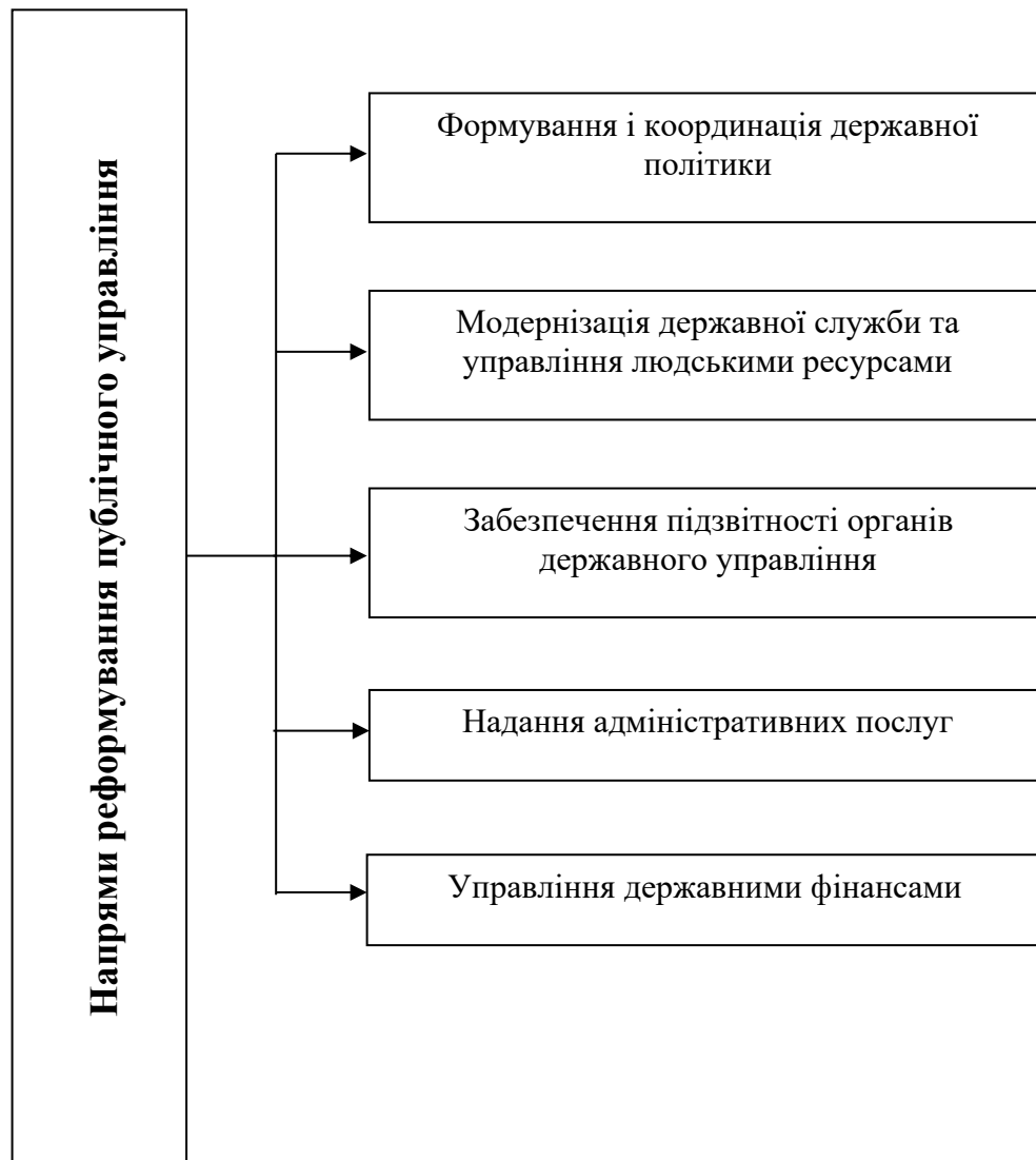
Рис. 2. Основні напрями реформування системи публічного управління в Україні