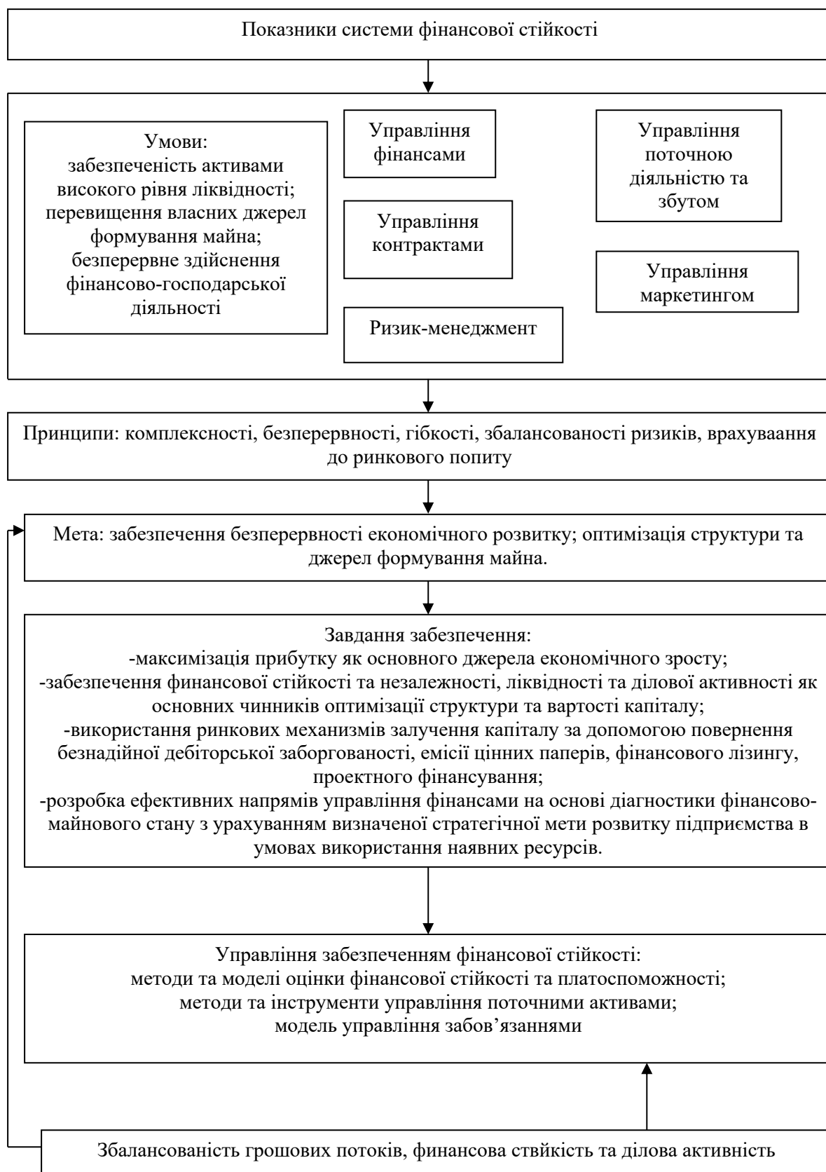
Рис. 3. Показники системи фінансової стійкості підприємств авіаційної промисловості