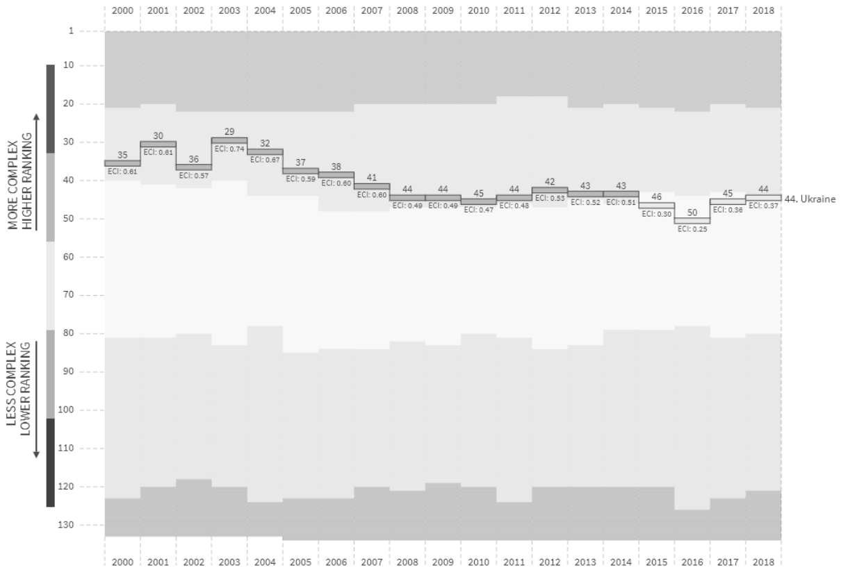
Рис. 2. Місце України в рейтингу економічної складності

індексом глобальної конкурентоспроможності Сінгапур займає перше місце. До п'ятірки найкращих в рейтингу входять США, Гонконг, Нідерланди, Швейцарія, далі йдуть Японія, Німеччина та Швеція [9].