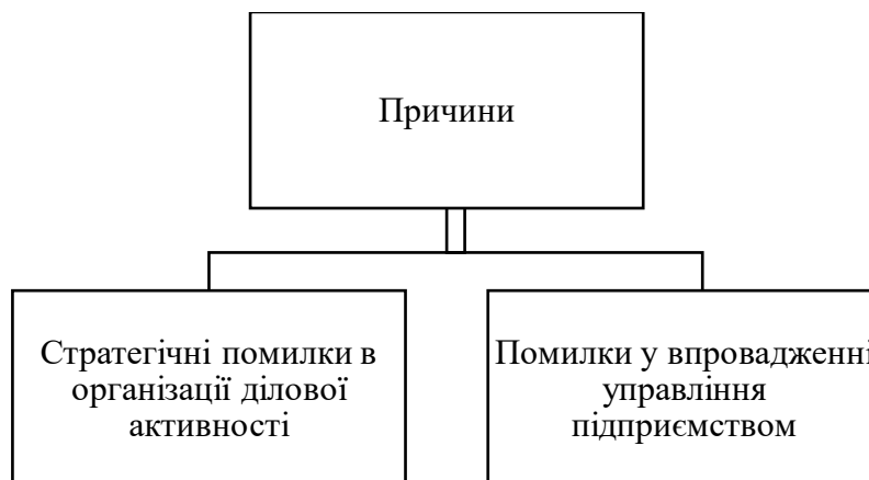
Рис. 1. Основні причини фінансової нестійкості підприємства

Діяльність компанії завжди пов'язана з появою великої кількості загроз, які можуть викликати фінансову ненадійність. Виділяють дві основні причини, які призводять до появи фінансової нестійкості підприємства, а, отже, і зниження її фінансової безпеки. Їх можна побачити на рис. 1.