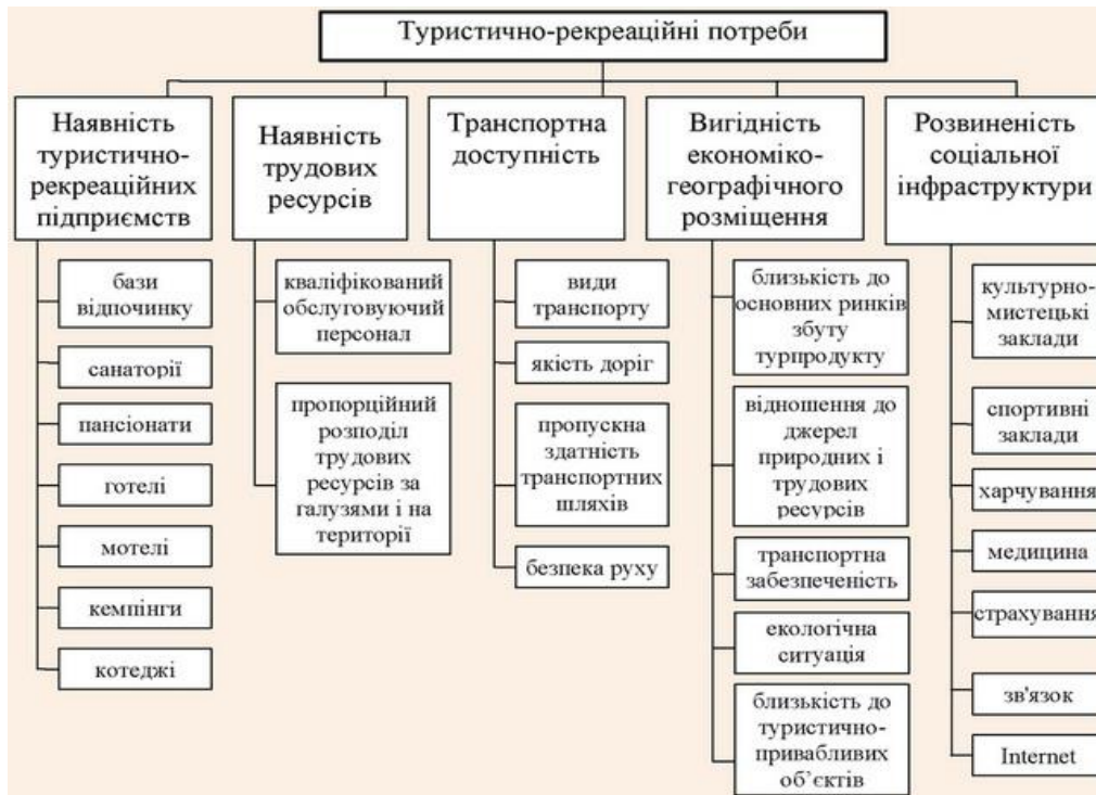
Рис. 1. Туристично-рекреаційні потреби населення