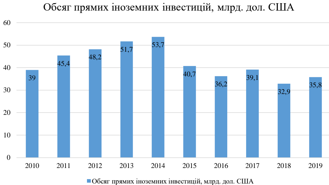
Рис. 1. Обсяг прямих іноземних інвестицій в Україні за період 2010-2019 рр., млрд. дол. США

Джерело: сформовано автором на основі офіційних даних Державної служби статистики України та Міністерства економічного розвитку та торгівлі України [2; 3, проаналізовано автором станом на 27.01.2021 р.]*