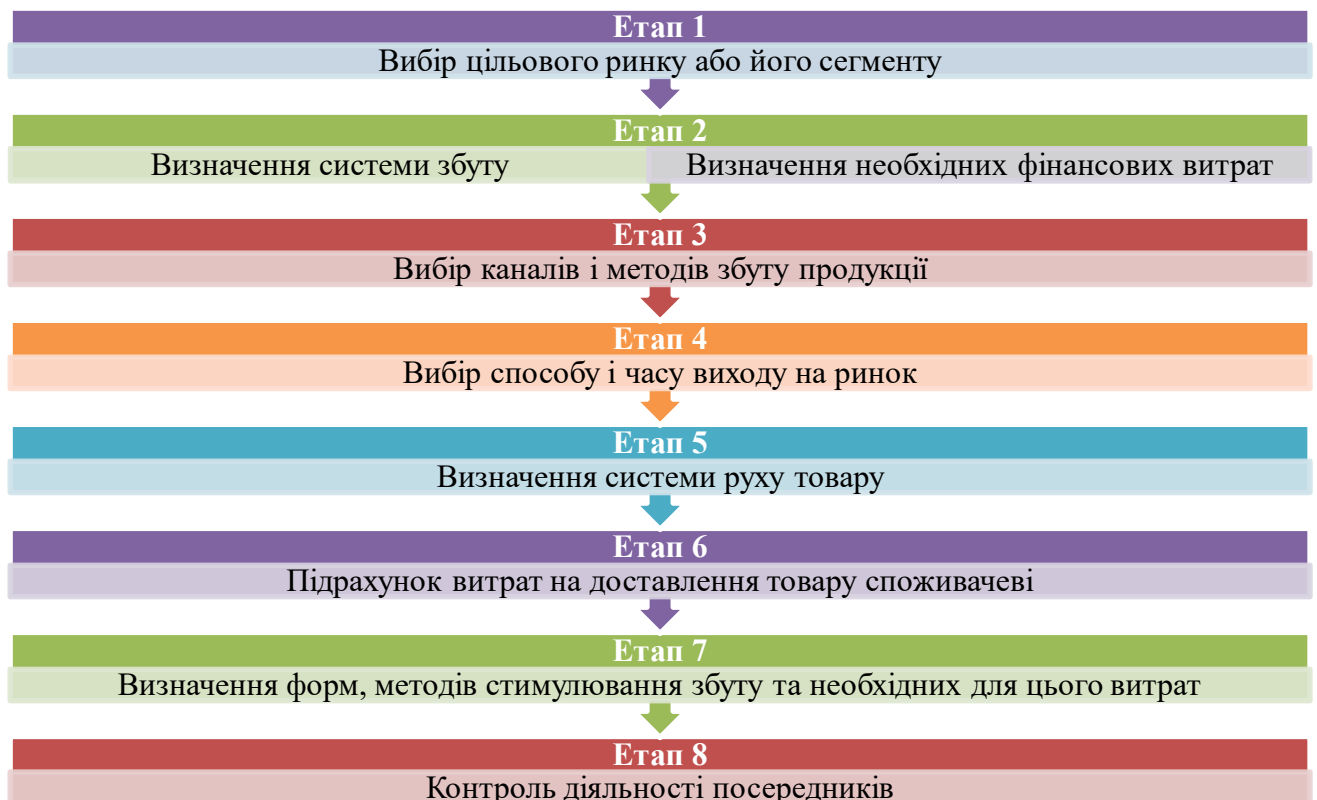
Рис. 1. Етапи організації збутової діяльності

Можна виділити вісім основних етапів організації збутової діяльності (рис.1).