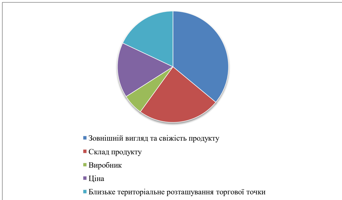
Рис. 4. Розподіл важливості факторів на поведінку споживачів при купівлі хлібобулочних виробів

З метою дослідження важливості факторів, які впливають на вибір споживачами хлібобулочних виробів, нами проведено анкетне опитування, в якому взяло участь 120 респондентів, віком від 18 до 70 років, які проживають в місті Києві та є постійними споживачами продукції ПАТ «КиївХліб» (рис. 4).