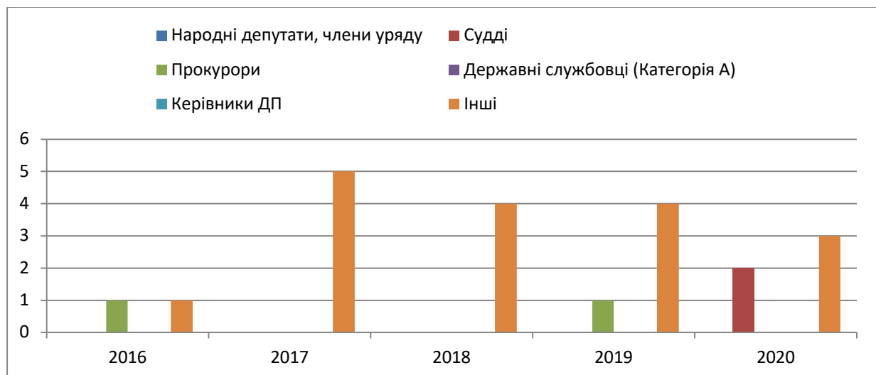
Рис. 2. Динаміка кількості осіб, засуджених за корупційні злочини у 2016-2020 рр.

Джерело: розроблено авторами за даними [15]