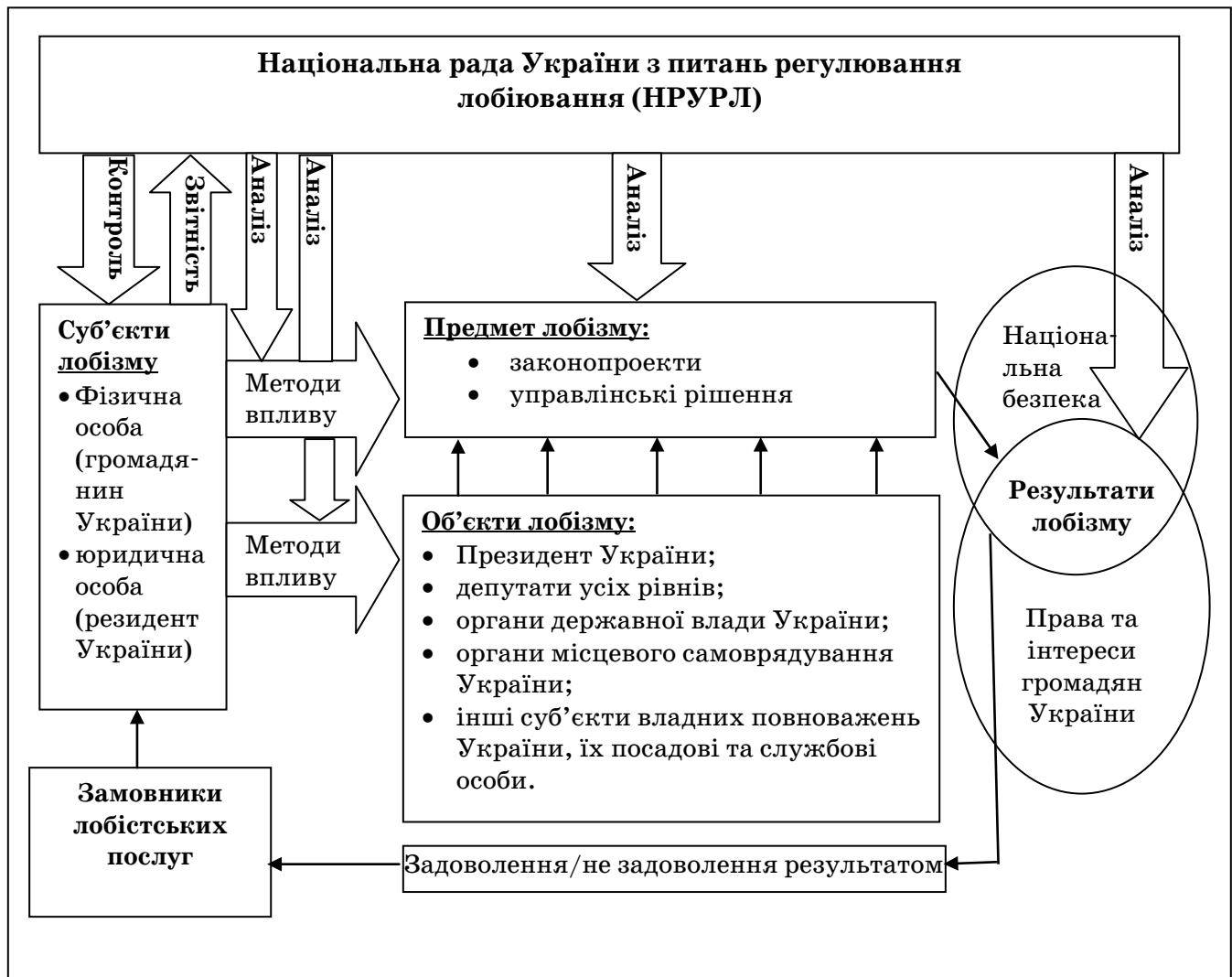
Рис. 1. Система лобізму

Таким чином, на переконання автора, система лобізму в Україні має являти собою сукупність взаємопов'язаних елементів (замовників лобістських послуг, суб'єктів лобізму, методів лобістського впливу, об'єктів лобізму, предмету лобізму, наглядової (контрольної) інституції), які у своїй взаємодії