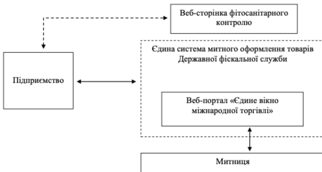
Рис. 1. Схема роботи підприємства з «Єдиним вікном міжнародної торгівлі»

Отже, перші кроки на шляху спрощення процедур митного оформлення товарів зроблено, необхідним є детальне опрацювання та визначення чіткої системи переходу та подальшої взаємодії підприємства (відповідальних осіб) з новим веб-порталом та митницею.