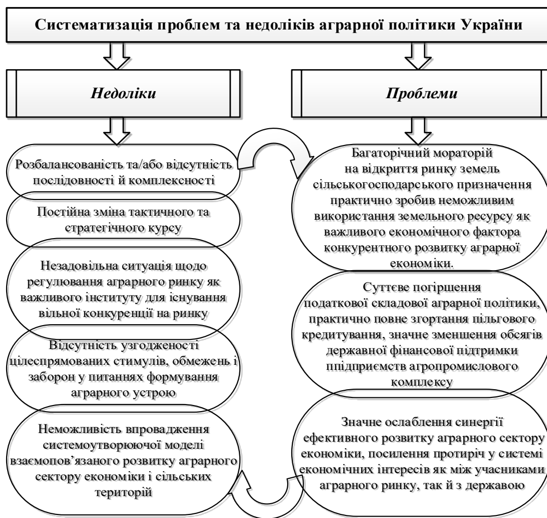
Рис. 1. Систематизація значущих проблем та недоліків аграрної політики України на сучасному етапі

Треба зазначити, що в умовах кризи та інтеграційних процесів в Україні інноваційний розвиток підприємств агропромислового комплексу можливий тільки за умов активізації загальних інноваційних процесів в економіці країни на основі використання нових теоретико-прикладних знань та потенціалу науки в процесі техніко-технологічної модернізації.