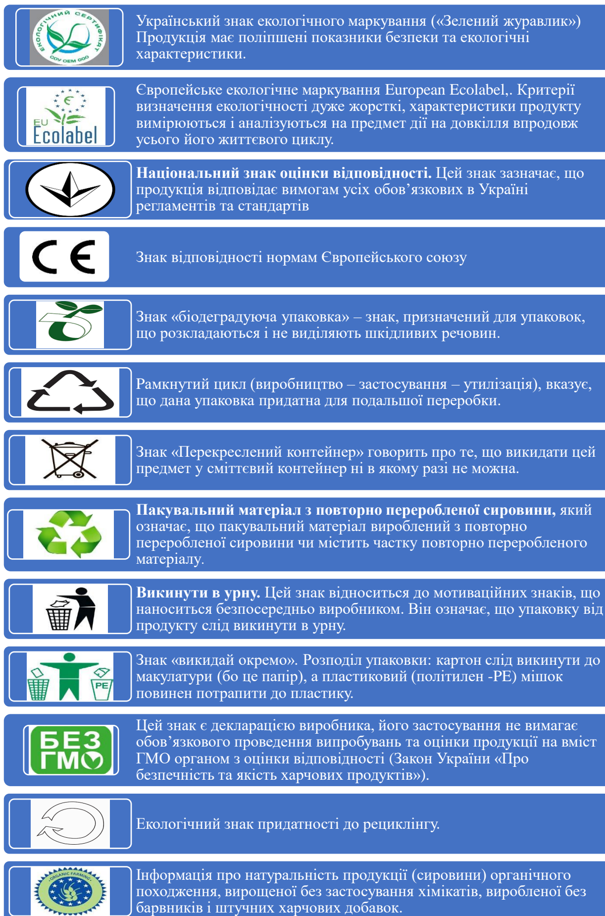
Рис. 3. Екознаки, що використовуються в Україні [7; 8]