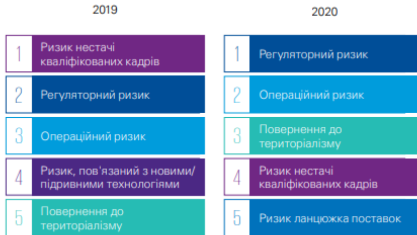
Рис. 2. Зміна загроз для зростання бізнесу в Україні [5]

Ринок праці є невід'ємною частиною економічної системи, оскільки саме на ринку праці відбувається формування, розподіл та відтворення робочої сили. Сегментами і світової, і української економіки, що не найбільше постраждали від пандемії коронавірусу COVID-19, є ринки праці у світі та Україні. Причому український ринок праці зазнав негативного впливу пандемії COVID-19 одразу за кількома напрямками.