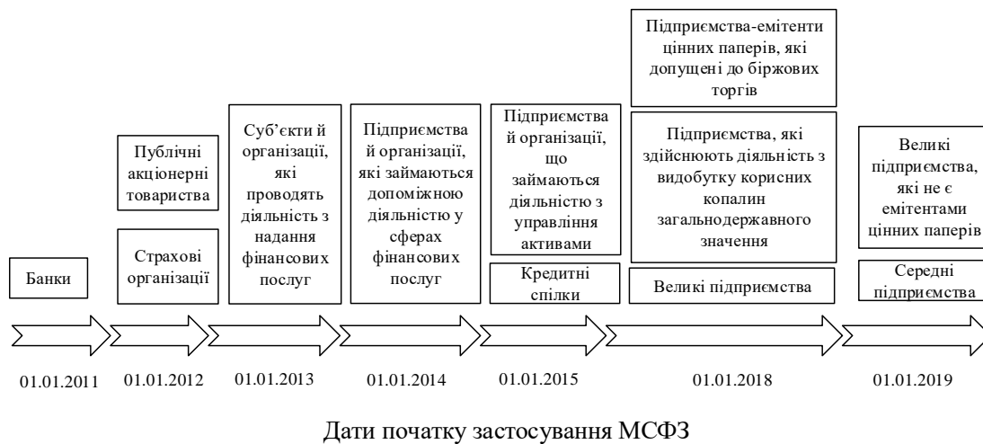
Рис. 1. Хронологічний перелік видів підприємств, які зобов'язані складати фінансову звітність за МСФЗ

Загалом практика впровадження МСФЗ на підприємствах України відбувається поступово. Хронологія впровадження МСФЗ у розрізі різних видів підприємств проілюстрована на рис. 1.