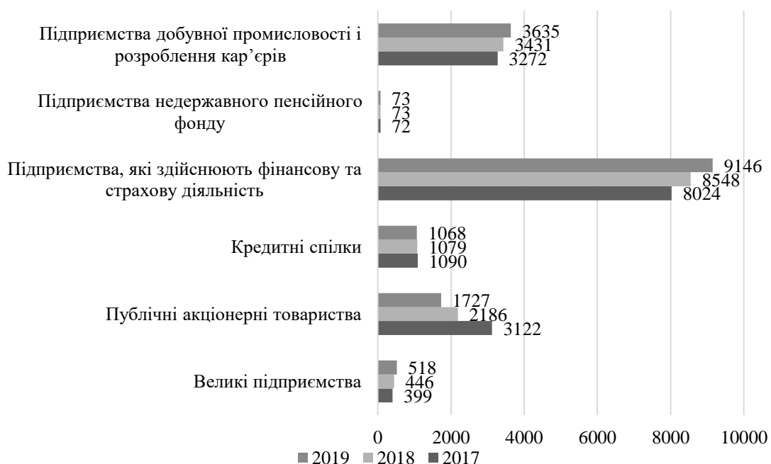
Рис. 2. Динаміка кількості підприємств України, які зобов'язані складати фінансову звітність за МСФЗ

здійснюють фінансову та страхову діяльність. Кількість цих підприємств зросла на 14% упродовж 2017-2019 років. Кількість підприємств добувної промисловості і розроблення кар'єрів та великих підприємств зросла на 11% та 30% відповідно у 2019 році. Тенденцію до зменшення кількості підприємств мали публічні акціонерні товариства та кредитні спілки. Проведені дослідження показали, що кількість підприємств, які є МСФЗ-зобов'язаними мають в основному зростаючу тенденцію протягом трьох останніх років.