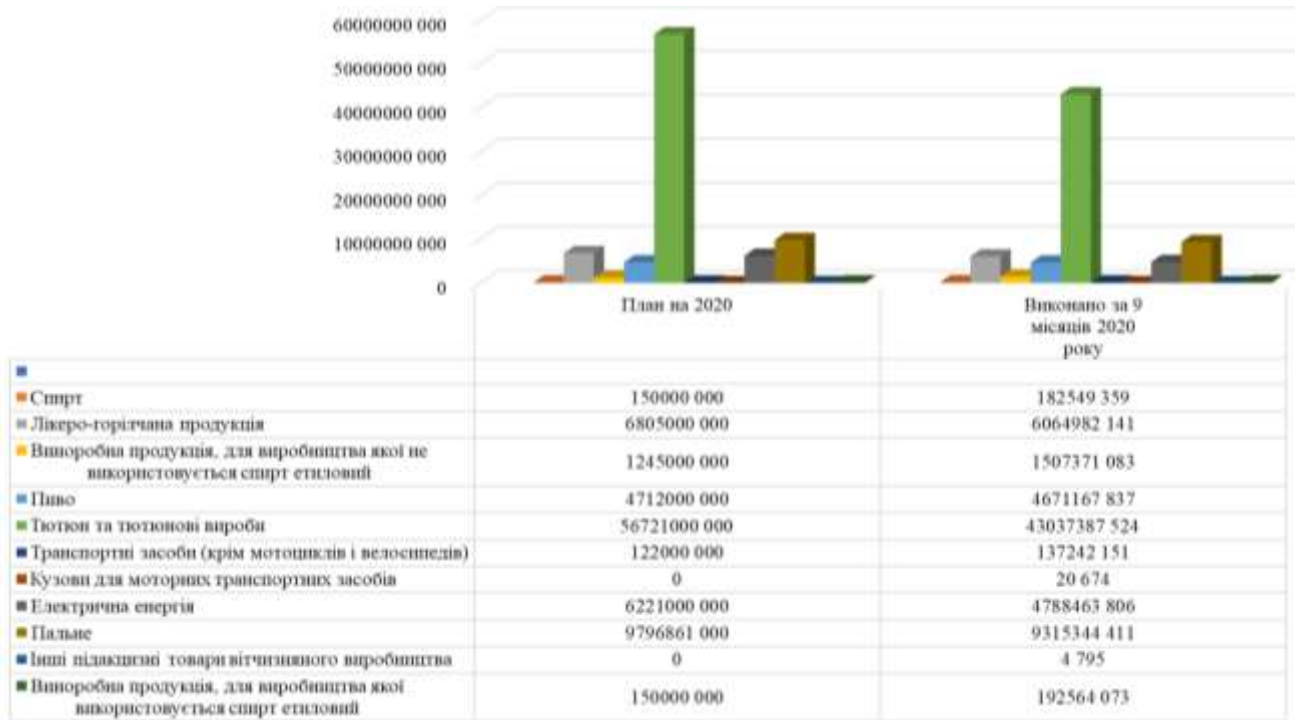
Рис. 3. Надходження акцизного податку із вироблених в Україні товарів (продукції) за 9 місяців 2020 року [10]

На рис. 3 наведено надходження від виробленої всередині країни акцизної продукції за 9 місяців 2020 року: