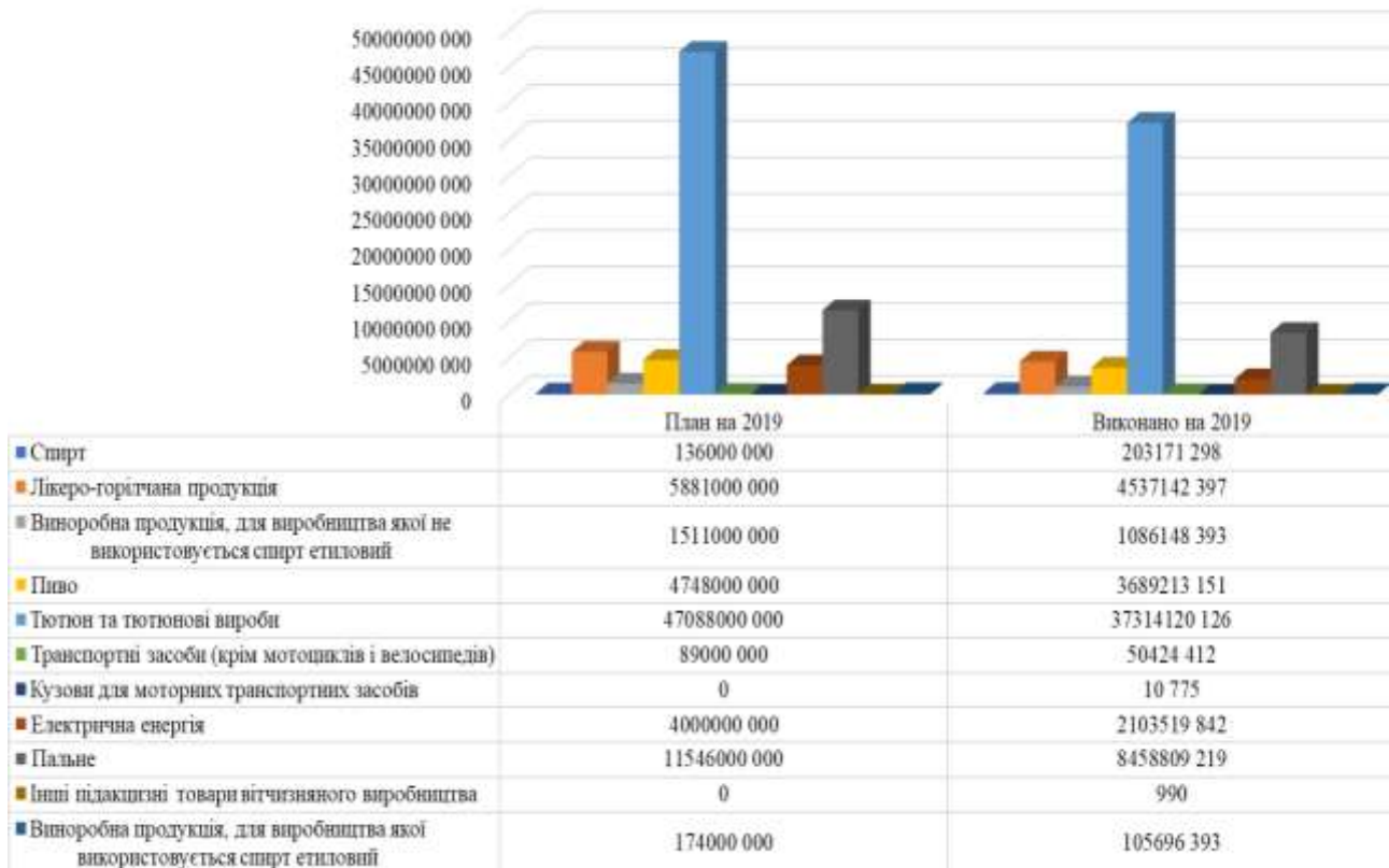
Рис. 2. Надходження акцизного податку із вироблених в Україні товарів (продукції) за 2019 рік [10]

кредити та ін.), а також через гарантії та надання послуг і товарів на пільгових умовах [7].