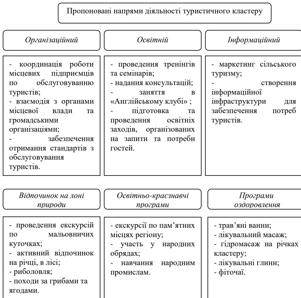
Рис. 2. Пропоновані напрями діяльності Туристичного кластеру «Тетерів»

Відпочинок на селі має стати основним турпродуктом кластеру на його перших етапах функціонування. Туристам запропонують агрооселі з усіма зручностями, екологічно чисті, натуральні продукти харчування, забезпечать дотримання стандартів з обслуговування. Кластер, за нашим баченням, повинен працювати за різними напрямками (рис. 2).