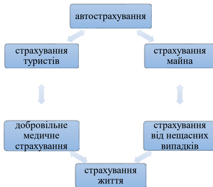
Рис. 3. Пріоритетні напрями розвитку страхового ринку України за 2018-2019 рр.

Ринок страхування майна, до якого можна віднести й страхування від вогневих ризиків та ризиків стихійних явищ, підігривають юридичні особи. Багато в чому це пов'язано з тим, що бізнес зіткнувся зі зростанням кількості пожеж.