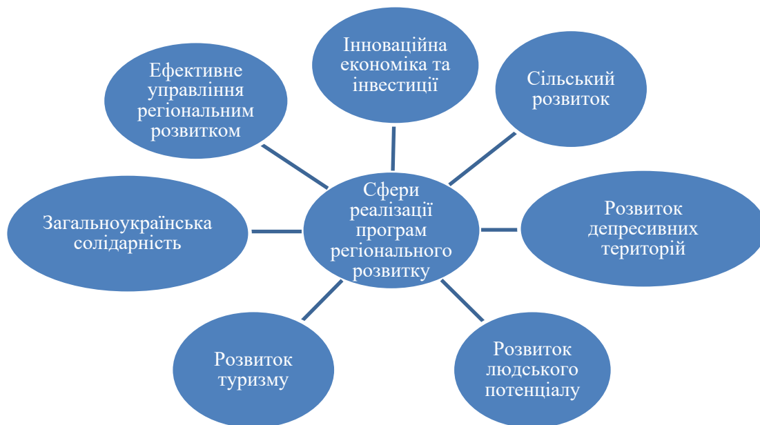
Рис. 3. Сфери реалізації програм регіонального розвитку відповідно до Державної стратегії регіонального розвитку на період до 2020 року

На практиці ключовими документами, якими визначають та задаються напрямки регіонального розвитку в Україні є прийнята у 2017 Державна стратегія регіонального розвитку на період до 2020 року [6] та розроблений до неї План заходів на 2018-2020 роки з реалізації Державної стратегії регіонального розвитку на період до 2020 року [7]. В межах даних документів, визначаються сім програм регіонального розвитку у наступних сферах (рис. 3):