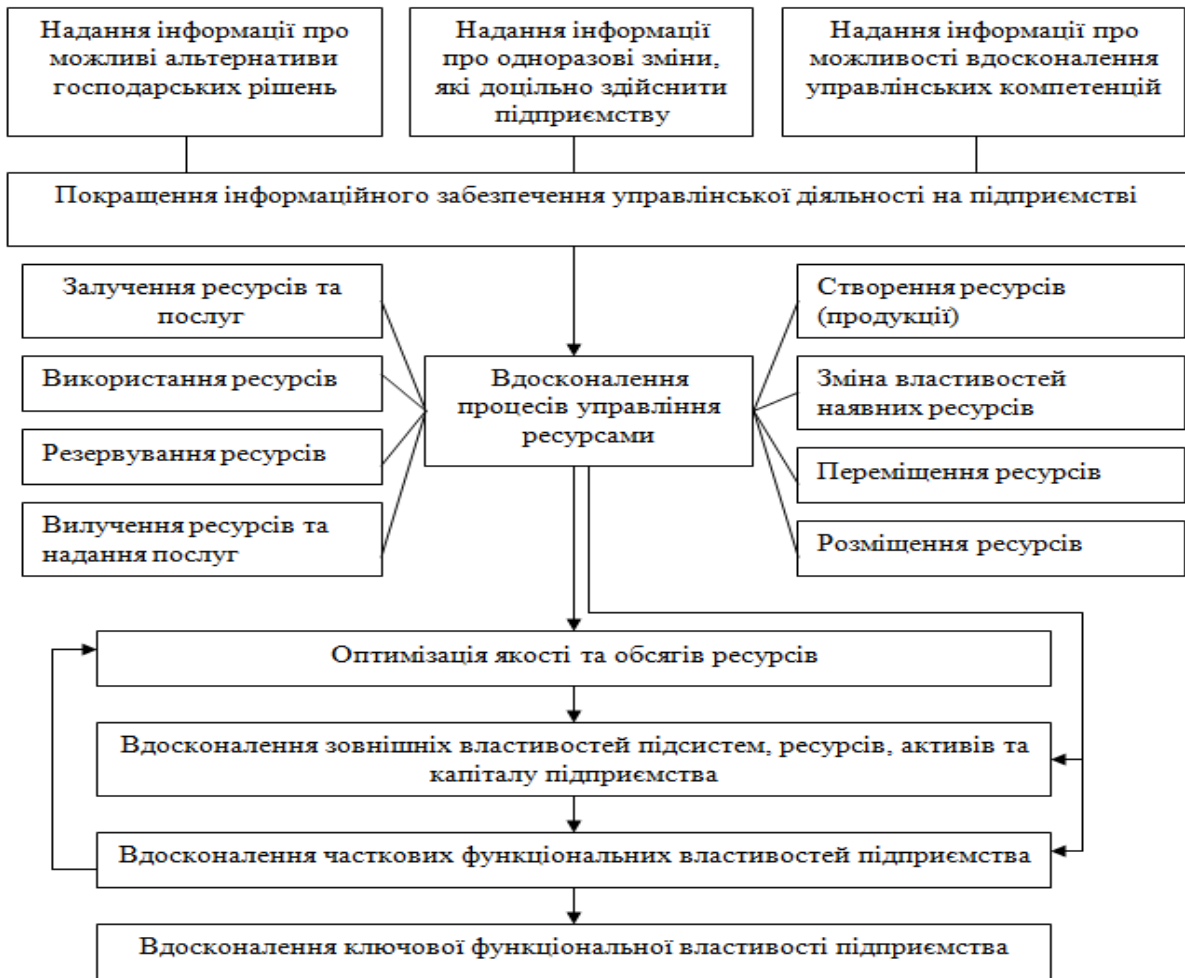
Рис. 2. Модель формування потенціалу економічного розвитку підприємства