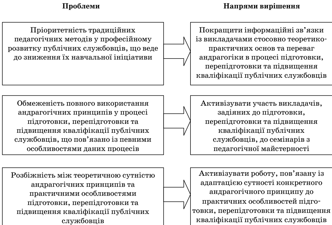
Рис. 1. Головні проблеми, які перешкоджають професійному розвитку публічних службовців на андрагогічних засадах