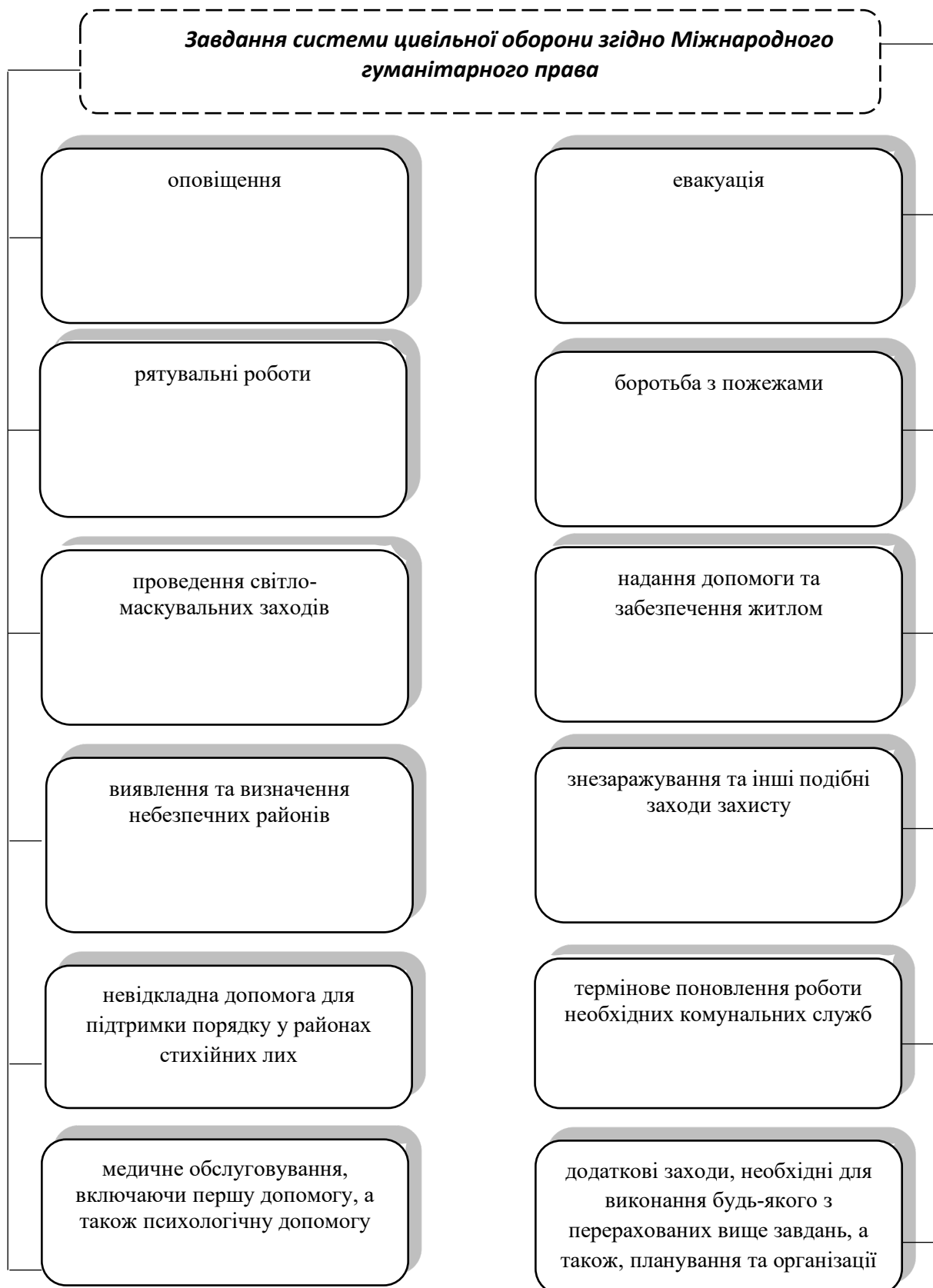
Рис. 1. Завдання системи цивільної оборони згідно норм Міжнародного гуманітарного права