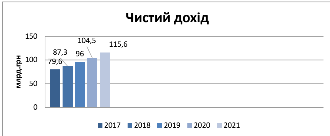
Рис. 3. Прогнозна динаміка чистого доходу «Укрзалізниці» у 2020-2021 рр.