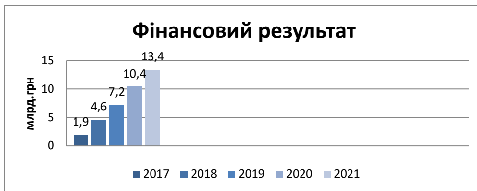
Рис. 5. Прогнозна динаміка фінансових результатів підприємства у 2020-2021 рр.

Наведені дані свідчать, що фінансові результати діяльності підприємства в середньостроковій перспективі матимуть тенденцію до покращення.