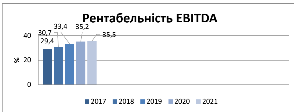
Рис. 4. Прогнозна динаміка рентабельності ЕВІТДА АТ «Укрзаліниця» у 2020-2021 рр.