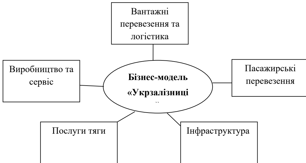
Рис. 2. Цільова бізнес модель «Укрзалізниці»

Для того, щоб визначити стратегічні можливості розвитку логістичної діяльності підприємства, необхідно описати цільову бізнес-модель, яку використовує підприємство. Графічне зображення якої наведено на рис. 2.