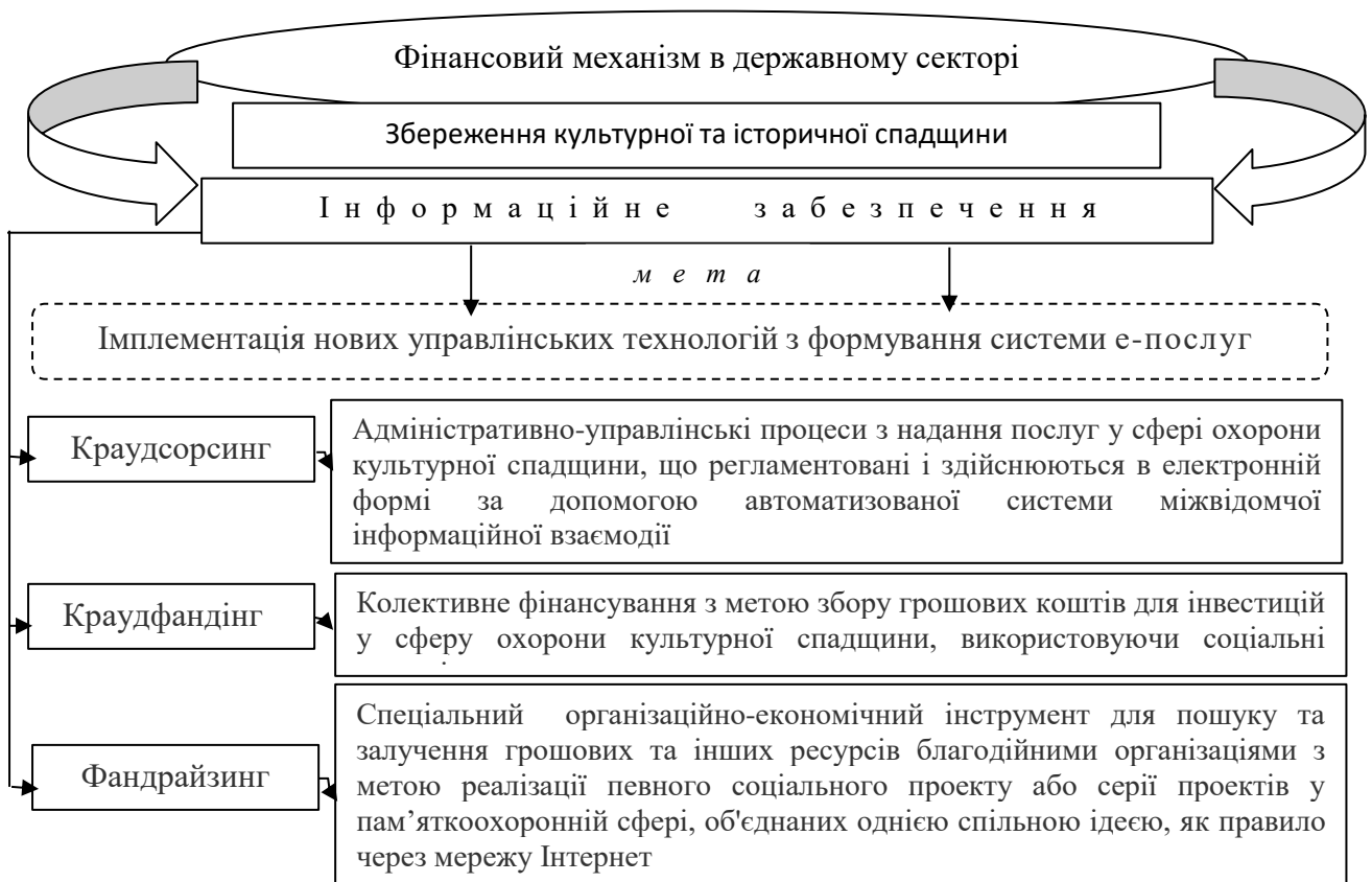
Рис. 2. Розвиток фінансового механізму в сфері туризму

економічний ефект та кожного року постійно збільшує надходження до державного бюджету України (табл. 2).