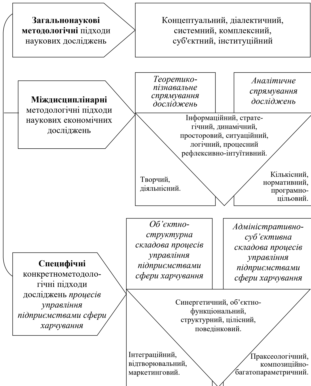
Рис. 1. Структуризація методологічних підходів дослідження процесів управління підприємствами сфери харчування